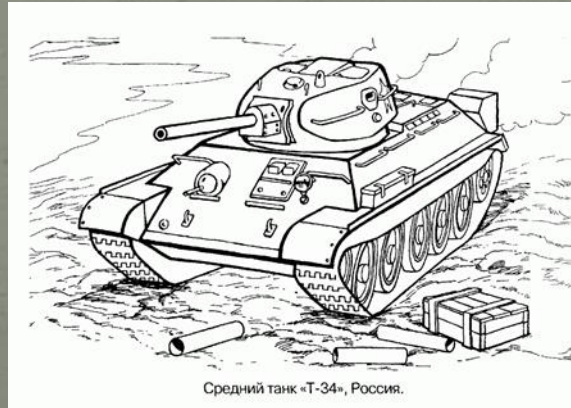
Средний танк «Т-34», Россия.